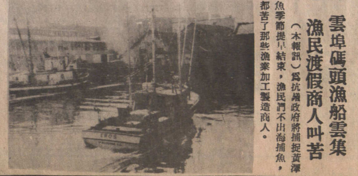
雲埠碼頭漁船雲集 漁民渡假商人叫苦

（五歲女童露露連連被偷車賊擄去兩天之後，終於被警方發現現蹤，於是經過一番緊張刺激的追逐，歹徒束手被擒，而被擄的女童亦重獲父母之懷抱。事後露露連連述述她的被擄，猶有餘悸。她失蹤時因父母把她獨自留在車內，偷車賊把她連車一併擄去。她是露露連連大姊姊，故當露露連連獲安全歸來時，歡喜若狂，竟跪在地上，被擄去時才十八歲，竟犯下土劫案。圖為露露連連獲救後的神態。