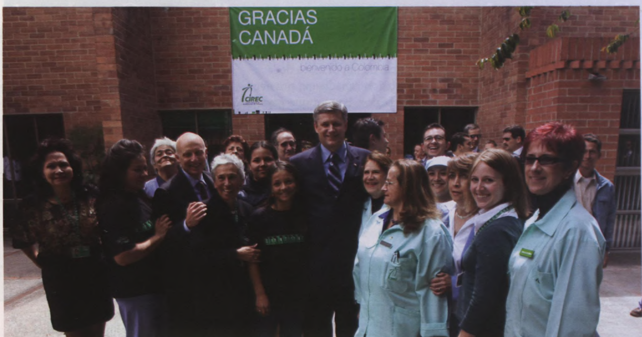
Le premier ministre Stephen Harper au Centre colombien de réhabilitation intégrale à Bogota, Colombie, lors de sa visite en Amérique du Sud et dans les Caraïbes en juillet 2007