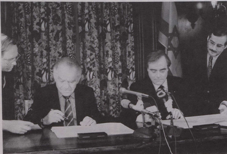
Le ministre des Communications, M. Marcel Masse (à droite), et le vice-premier ministre des Affaires extérieures d'Israël, M. Yitzhak Shamir, signent un accord de coproduction cinématographique et vidéo.

La compagnie Gandalf Technologies Inc., de Manotick (Ontario), vient de recevoir d'une société de taxis de New York une commande de un million de dollars pour la fourniture et l'installation d'un système entièrement informatisé de répartition des taxis. Un porte-parole de la société Gandalf a précisé que ce contrat avec Bell Radio Taxi Inc. représentait un premier pas dans l'implantation de la répartition informatisée des taxis à New York, système qui permet d'accroître la rentabilité d'une flotte de taxis.