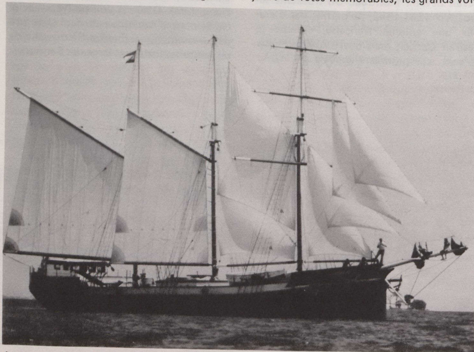
Le grand voilier Onaycorah.

La compétition comprend six courses classées en trois catégories (A,B,C), en fonction de leur longueur. Une septième