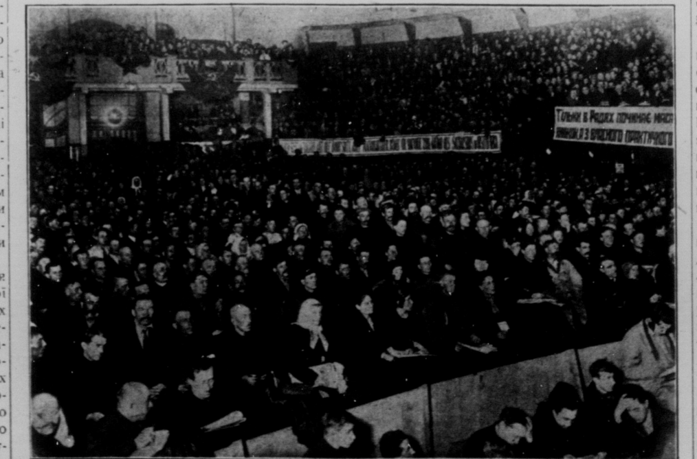
Десятий Всеукраїнський З'їзд Рад, що відбувся в Харкові, в театрі ім. Шевченка в дніх від 6-го до 10-го квітня 1927 року.

лістичного будівництва в нашій державі. До цього розвитку науки й культури необхідно приєднати ще величезну роботу в нашій книжково-газетно-видавничій діяльності. Ще не так давно наші українські газети та книжки були одиницями. Нині їх десятки і сотні тисяч поширилися по всій Україні. Таким чином, у великому Жовтневому перевороті пощастило провести небувалу реформу нижньої, середньої й вищої народної освіти, що в кілька разів перевищує передвоєнні досягнення в цій галузі й забезпечує надалі правильну організацію й зріст нашої радянської науки й культури. Коли раніш, під час царату і панування дворянства й буржуазії письменних в місті було 43%, а на селі 15%, то нині, всього тільки за 5 років нашої напруженої роботи в цій галузі ми маємо збільшення числа письменних в два рази, а по декуди і в три рази. Коли раніше тільки на селі бібліотека, то тепер ми маємо 3,500 сельбудів, 6,500 хат-читалень понад тисячу шкіл для ліквідації неписьменності і кілька тисяч пунктів, що працюють над ліквідацією неписьменності. А коли ще до цього додати величезний вплив на третій сторони.)