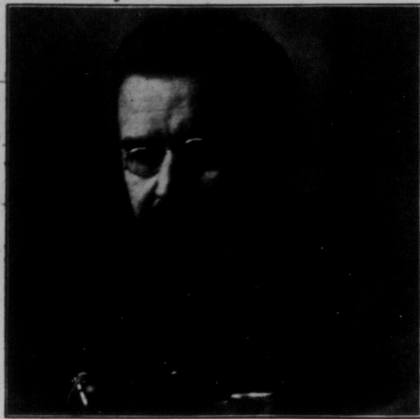
ГРИГОРІЙ ІВАНОВИЧ ПЕТРОВСЬКИЙ, Голова Всеукраїнського Центрального Виконавчого Комітету.

Вступна промова Г. І. Петровського на історичній сесії Всеукраїнського Центрального Виконавчого Комітету 8. жовтня 1927 р. в театрі ім. Т. Шевченка в Харкові