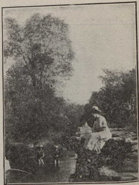
SECONDE MENTION.—“Partie de pêche”, aux Forges, Radnor, par J. M. Loranger, Montréal.

Les moissonneurs de l'ouest vont récolter cette année 125,000,000 minots de blé. Ils ont 85 cents par minot de blé à la gare de chemin de fer, qui le transportera ensuite. Ils vont donc retirer cette année cent millions de dollars avec la récolte du blé seulement.