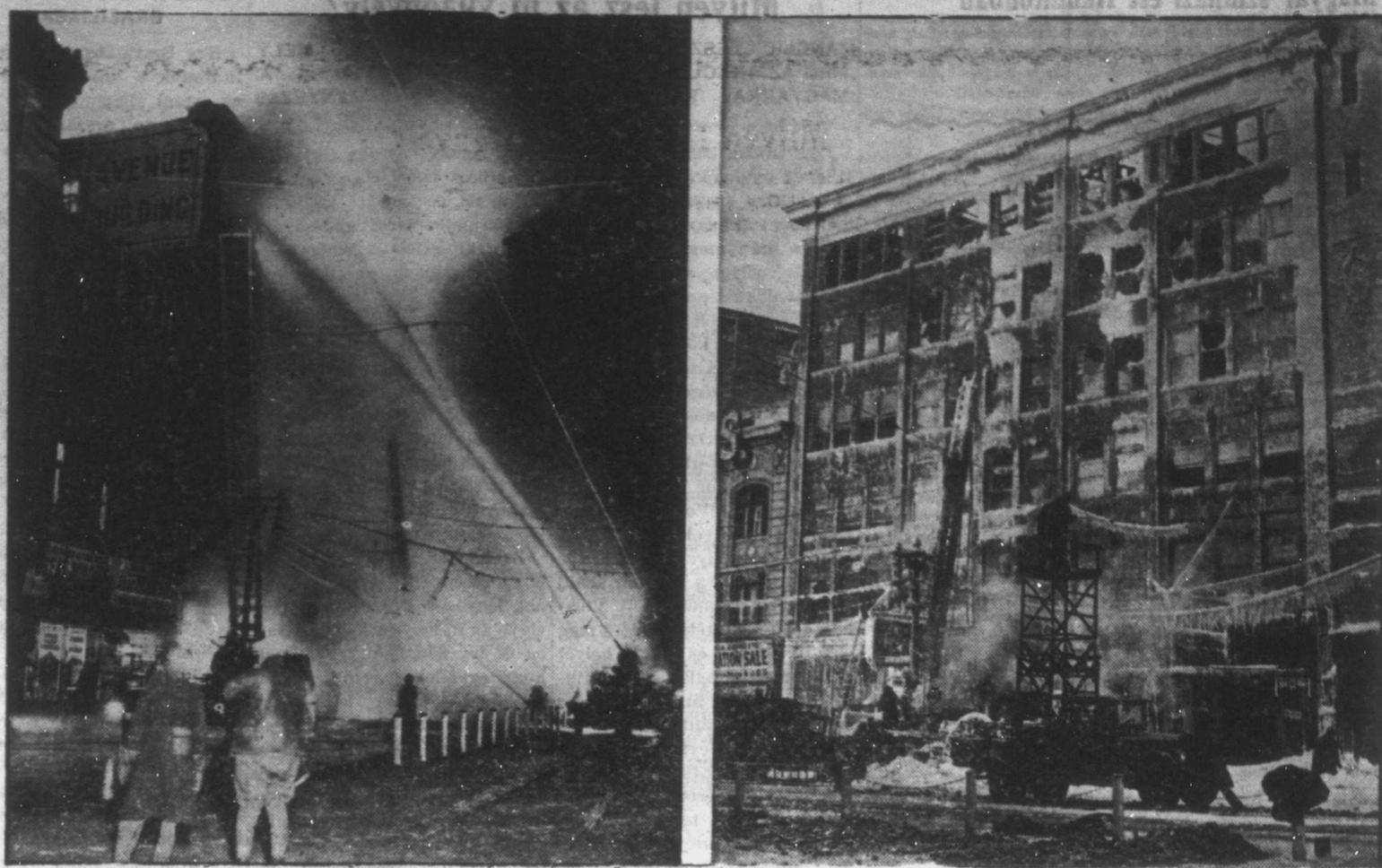
Mint már jeleztük, a winnipeg "Avenue Block" épületét hatalmas tüzvész pusztította el múlt vasárnap hajnalban. A Winnipeg Tribune fent bemutatott baloldali képe az éjszaka sötétjében dolgozó tűzoltókat mutatja be, míg jobboldali képünk a kiegészítő épületekre fagyott jégcsapokat láthatjuk olvasóink. Tekintettel arra, hogy a lépcsőházat teljesen elhamvasztották a lángok, az el nem égett berendezést az ablakpárkányra erőltetett csigákkal távolították el. Múlt pénteken este 8 órakor sokkal veszedelmesebb természetű tűz ütött ki Calgary "Palace" mozgószínházának pinchehelységében. Straw igazgató azonban azt jelentette be a színpadról, hogy a szomszédos épületben ütött ki jelentéktelen tűz, de azért biztonság kedvéért kéri a közönséget, hogy nyugodtan hagyja el az épületet. Alighogy a kétezer főnyi tömeg tolongás nélkül eltávozott: 35 láb magasra csaptak fel a lángok. Az anyagi kár biztosítás révén megtérül, emberéletben pedig nem esett kár.

KI MIT TUD, KI MIT LAT, KI MIT HALL: KÖZÖLJE A KANADAI MAGYAR UJSÁGAL