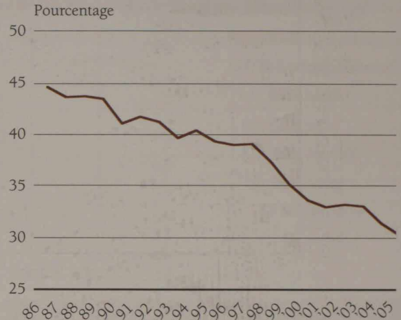
Part des échanges intra-entreprises dans le commerce entre le Canada et les États-Unis