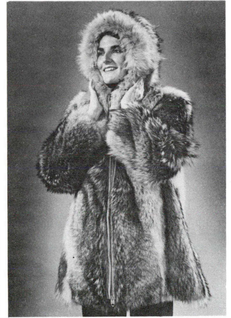
de Baker Lake (T. N.-O.). L'anorak de peau de loup (à droite) a été confectionné à Aklavik, (T. N.-O.).

Cette exposition est une initiative du Conseil canadien des arts esquimaux du ministère des Affaires indiennes.