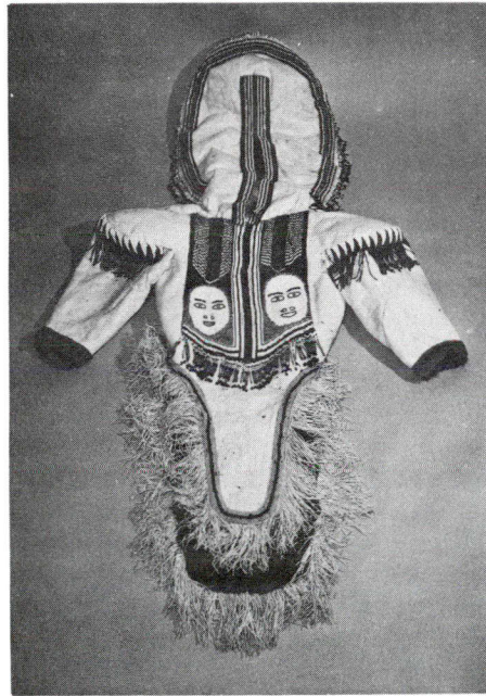
peut admirer un manteau et une mante garnis de renard de l'Arctique et confectionnés à Spencer Bay (T. N.-O.). On voit aussi un "attigi", anorak de peau de caribou réversible porté sous un autre anorak de même cuir, envoyés