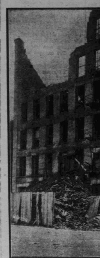
Ruinerna af Sterling Furniture Co.'s hus i Winnipeg som rasade i torsdags