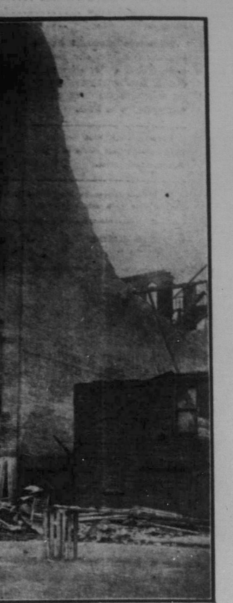
Ruinerna af Sterling Furniture Co.'s hus i Winnipeg som rasade i torsdags