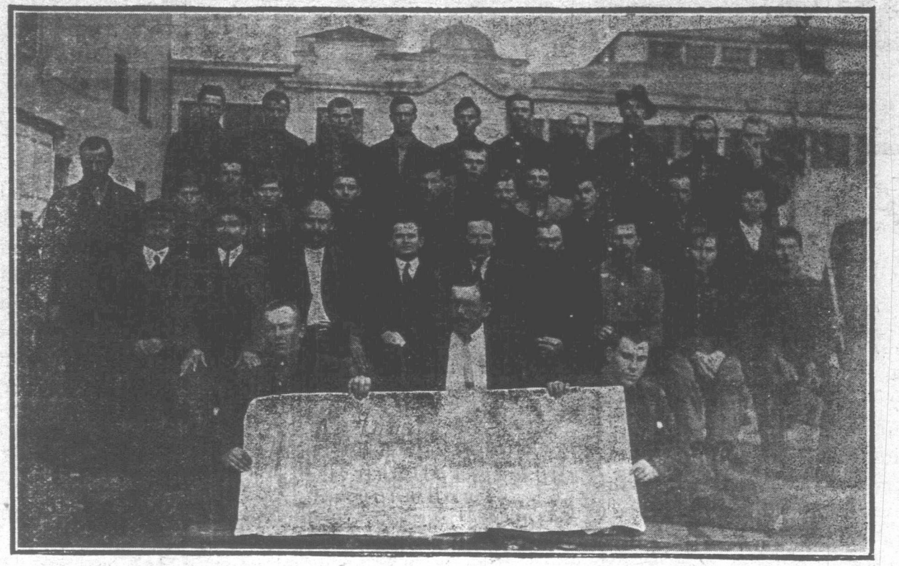
(Образ з календаря „Укр. Родина" на 1916 р.)