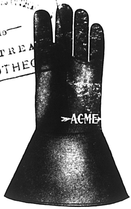
1072-1—Gantelet en peau de cheval non doublé, avec dos en peau de cheval "split" et manchettes. En stock.

Retenez sa clientèle et développez-la, en lui offrant des Gants et Mitaines de Travail ACME tels que ceux illustrés ci-contre.