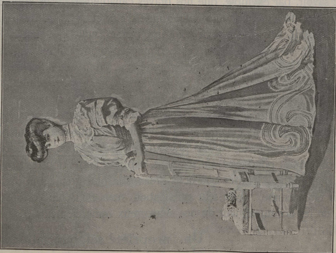
Robe de foulard liberty blanc, petits pois noirs. Jupe garnie de petite dentelle Valenciennes plissée et de lisérés de satin. Corsage ouvert sur un gilet de mousseline orné d'entre-deux. Haute ceinture en foulard terminée par une boucle.