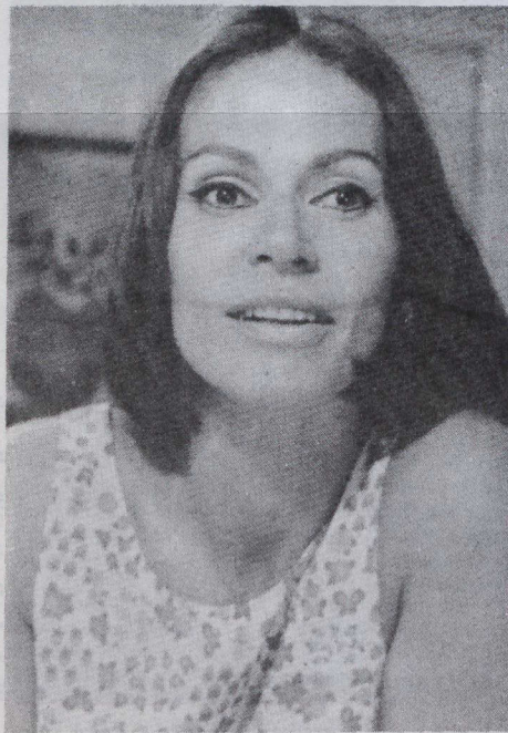
Monique Mercure, Officier.

— M. John Charles Polanyi, né en Allemagne. M. Polanyi fut le premier homme de science nommé professeur titulaire ( University professor ) de chimie de l'Université de Toronto. M. Polanyi s'est distingué par ses recherches dans le domaine de la chimie moléculaire. Outre la renommée internationale qu'il s'est acquise grâce à ses recherches dans la physico-chimie fondamentale, M. Polanyi est bien connu pour son travail et son engagement dans le domaine du désarmement nucléaire. Il s'intéresse particulièrement à la