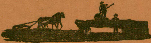
"La Canadienne" Presse à foin en acier et en bois.

Charrues, Horses a ressort Horses a roulette et Se- moir a 8 sections.