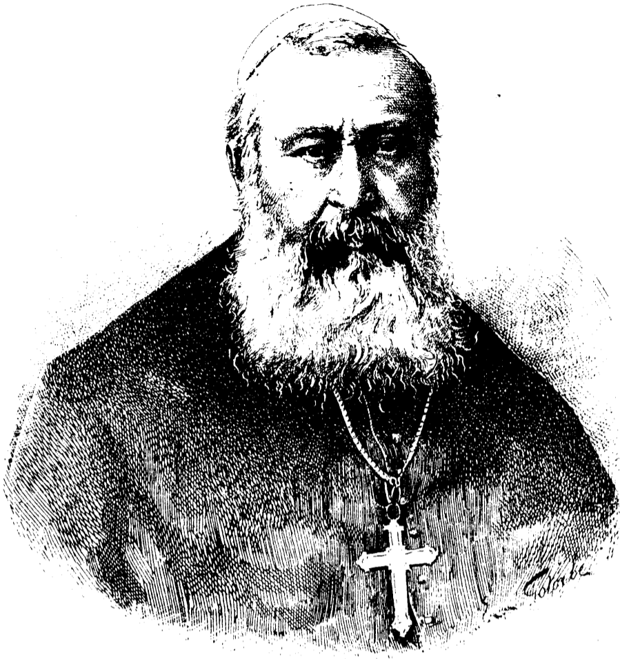
MGR. DE LAVIGERIE, ARCHEVÊQUE D'ALGER, VICAIRE APOSTOLIQUE EN TUNISIE