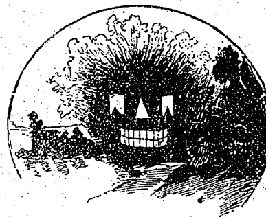
Le même vu le soir après dîner.