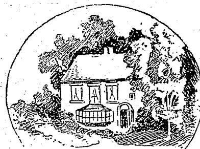
Cottage vu le jour et à jeun.

Elle. —Souvent, j'aime beaucoup les bêtes et c'est le seul endroit de la ville où elles sont en liberté.