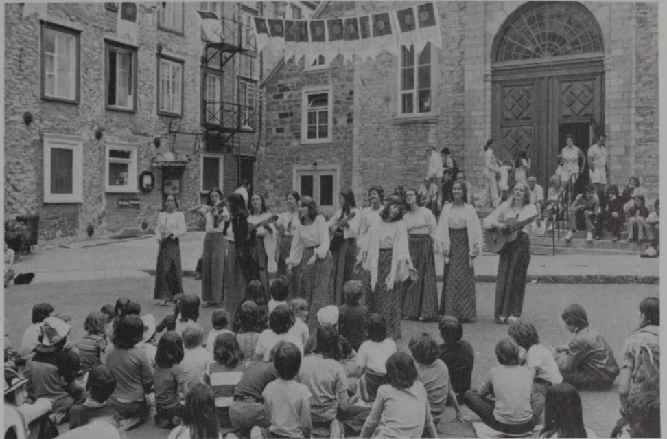
Een straatvoorstelling door artiesten uit Quebec: een dagelijks toneel in Quebec City.

Een romantisch doorkijkje, langs drogende visnetten, op Perce Rock, vanaf het strand van de Village of Perce, Quebec, het meest oosters gelegen punt van de provincie.