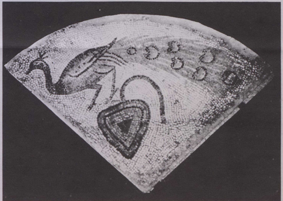
Mosaico en el que se ve un pavo real y una hoja de vid sobre piedra y estuco (Mediterráneo Oriental, siglo VI).

Una presentación audiovisual subraya el aspecto de la exhibición viajera del medio cultural que produjo las actuales tradiciones bíblicas.