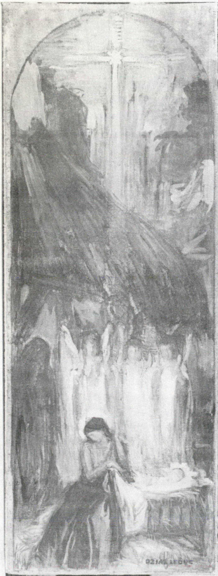
La Nativité (1922)