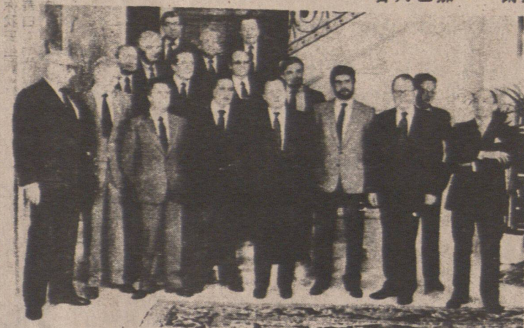
歐洲經濟共同體委員會成員合照