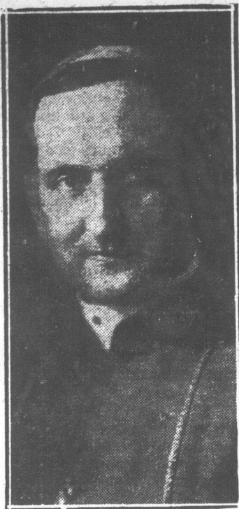
S. G. Mgr Georges COURCHESNE, ami et bienfaiteur de l'agriculture.

beaucoup plus incliné à l'étude et à la méditation qu'à l'action. On l'imaginait volontiers sous le froc du bénédictin, et son âme est agissante à la manière de celles des grands contemplatifs. Ceux-ci recherchent la spéculation par goût et tempérament, et doivent réagir fortement sur eux-mêmes avant que d'agir sur les autres par devoir.