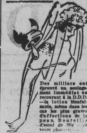
RAYMOND BREAUX pharmacien

Une formule très satisfaisante pour une pâte à poussins est la suivante: partie égale par poids de gru rouge (petit son), de gru blanc (recoupes), de maïs jaune