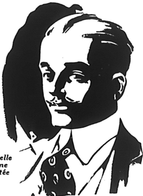
Nouvelle forme ajustée

Boeuf fumé en tranches, pots en verre . . . . . 1s. 3.45