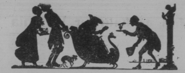
Die Jugend ist noch voller Feuer — Im Alter friert man ungeheuer.