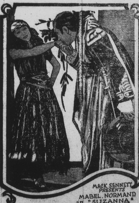
MACK SENNETT PRESENTS MABEL NORMAND in SUZANNA