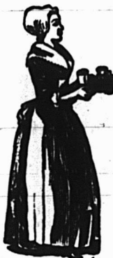
Registered U.S. Pat. 02