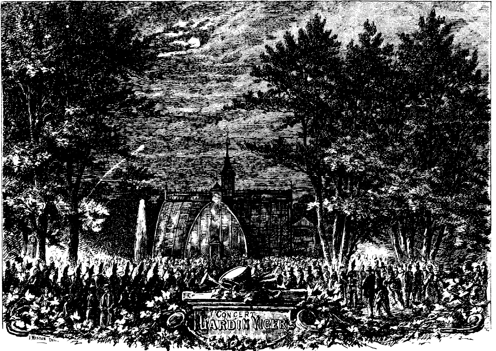
LE JARDIN VIGER, LE SOIR DU 24