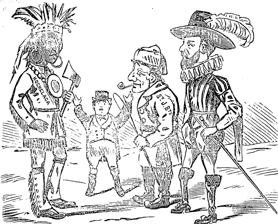
L'ANNEXION John Bull se trouve embêté par la nouvelle compagnie qui lui est introduite par le Conseil de Ville.

Demandez Bonsoir Maman ! blquette pl. dans la collection de la Musique populaire — 10 cts.