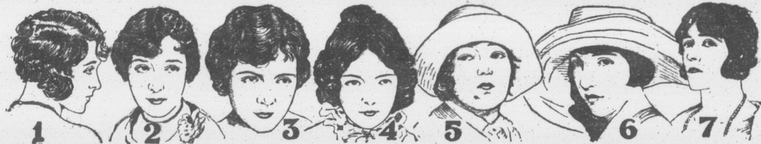
Comment l'annonceur donna les noms des vedettes ci-dessus tout embrouillées:—

131 Succursales dans les Provinces de Québec, d'Ontario, du Nouveau-Brunswick et de l'Île du Prince-Édouard.