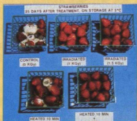
Aliments irradiés et non irradiés