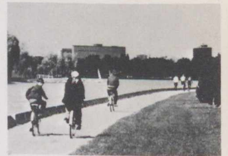
Au bord de la Rideau.

Lorsque les habitants d'Ottawa se prirent de passion pour la bicyclette, il y a maintenant trois ou quatre ans, les pouvoirs publics ne tardèrent pas à les encourager dans cette voie. La Commission de la capitale nationale, responsable de l'aménagement d'une zone qui groupe plusieurs villes et abrite quelque six cent mille habitants, décida de construire des pistes qui seraient réservées aux cyclistes. Elle s'attacha d'abord à relier les quartiers résidentiels aux quartiers d'affaires, pensant ainsi encourager l'usage de la bicyclette comme moyen de transport. La première piste fut ouverte en mai 1971. Le réseau