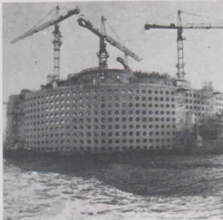
Contre la houle.

Construite récemment pour stocker cent soixante mille mètres cubes de pétrole brut à proximité des champs pétrolifères de la mer du Nord, l'île artificielle d'Ekofisk est protégée par une digue d'un type nouveau qui est de conception canadienne. Haute de quatre-vingt-dix mètres, la digue est faite de béton à caissons perforés. Grâce aux perforations, les hautes vagues ne viennent pas s'écraser contre une paroi continue mais trouvent au contraire des passages qui permettent à de grandes quantités d'eau de pénétrer dans l'espace compris entre la digue et les réservoirs de pétrole. Absorbée par frottement et par turbulence dans cet espace de tranquillisation, une grande partie de l'énergie d'impact est sans