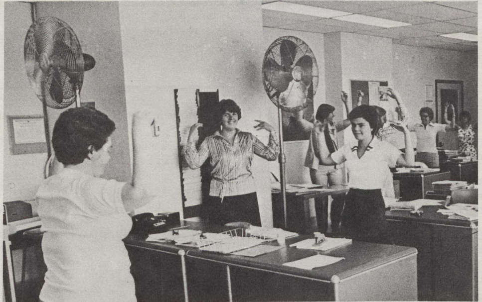
Employées de bureau pendant la "pause-exercice".

Plus de 60 000 employés de 51 entreprises privées et agences gouvernementales ont pratiqué la course à pied et participé à de nombreux exercices physiques, dans le cadre du Programme 1978 de conditionnement physique des employés, administré cet été par l'Association canadienne d'hygiène publique.