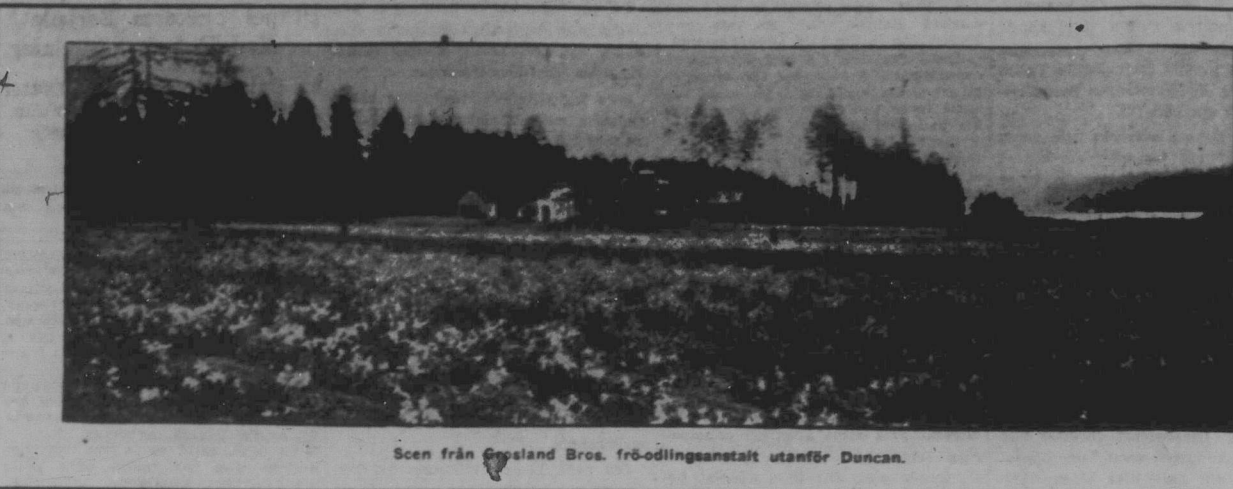
Scen från Cowichan Bros. fröodlingsanstalt utanför Duncan.