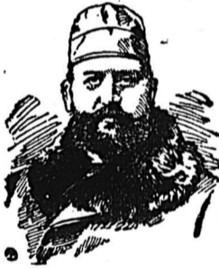
EX-MAYOR DANIEL F. BEATTY.

From a Photograph taken in London, England, 1889.