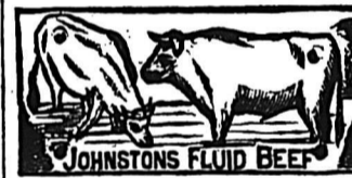
JOHNSTONS FLUID BEEF

La remise d'argent est faite immédiatement après la vente.