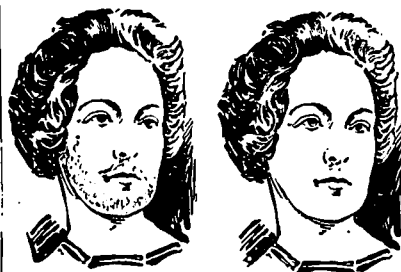
AVANT L'EMPLOI. APRÈS L'EMPLOI.

—Moi! comtesse, des tours pendables à ma famille!