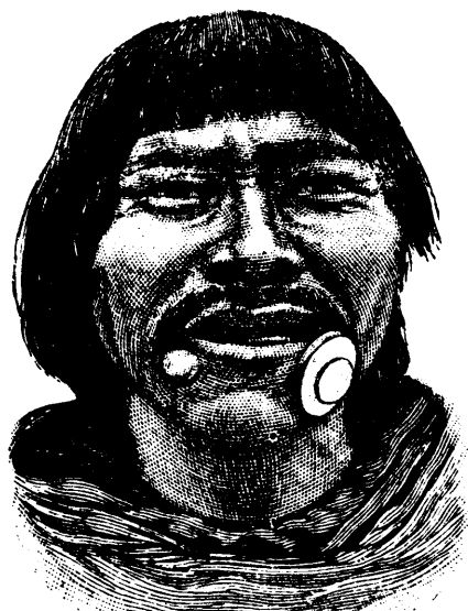
ORNEMENTS DU MENTON

Les illustrations de cette page sont faites d'après des photographies prises sur divers points de la côte de l'Alaska, visitée par les baleiniers, les traitants et les vaisseaux du gouvernement américain. Les femmes et les enfants esquimaux sont natifs de l'île Saint Laurent ; ce morceau de terre, en