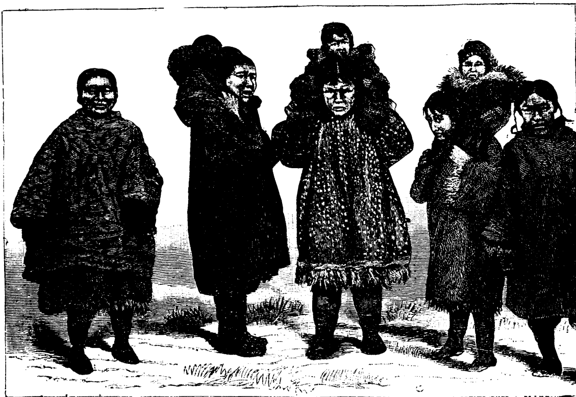
FEMMES ET ENFANTS

Les illustrations de cette page sont faites d'après des photographies prises sur divers points de la côte de l'Alaska, visitée par les baleiniers, les traitants et les vaisseaux du gouvernement américain. Les femmes et les enfants esquimaux sont natifs de l'île Saint Laurent ; ce morceau de terre, en