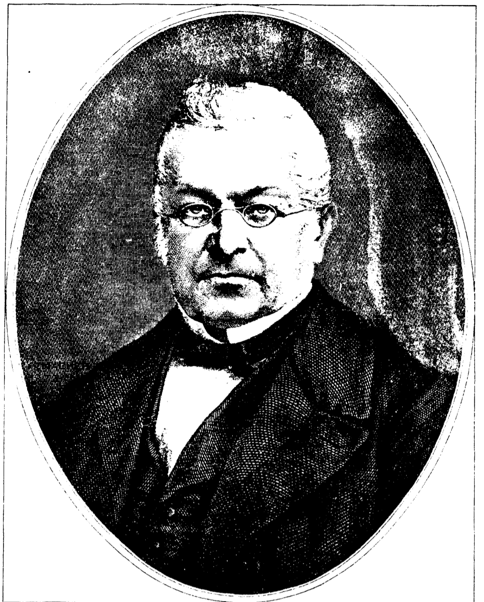
LOUIS ADOLPHE THIERS, DÉCÉDÉ