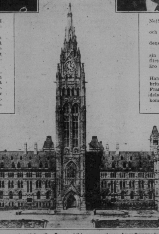
Parlamentsbyggnaderna i Ottawa, en pittoresk grupp i gotisk stil. Denna bild representerar huvudbyggnaden, vars torn kan ses på flera mils avstånd

Till vänster generalguvernören, längst bort från kameran. Till höger Rt. Hon. W. L. MacKenzie King, Canadas premiärminister.