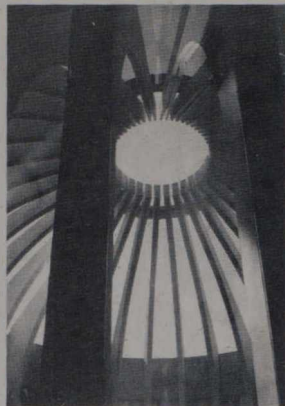
In copertina: Lucernaria della Simon Fraser University

La Commissione Applebaum-Hébert solleva interrogativi sul metodo di diffusione culturale, di promozione della creatività, di conservazione delle tradizioni, proponendo cambiamenti radicali.