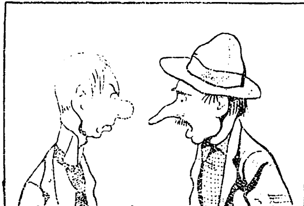
ECHANGE DE NEZ