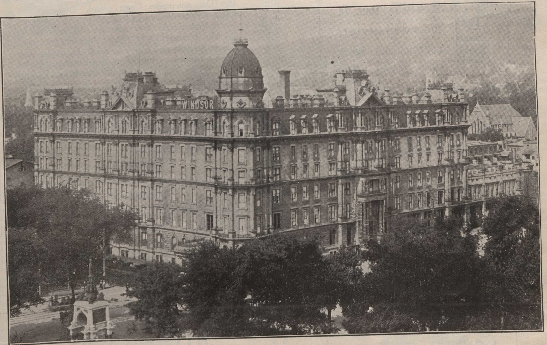
L'hôtel Windsor, de Montréal.

Pour les autres pays de l'Union Postale: Abonnements: $3.50 par année, ou 18 francs.