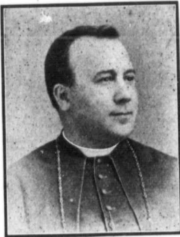
MGR LANGEVIN, Archevêque de St-Boniface, Manitoba.