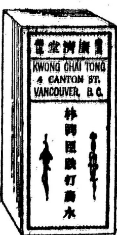
注意注意 注意注意