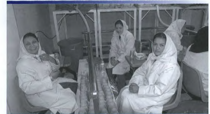
La fabrique de shampooing canado-afghane emploie des veuves de guerre, qui pour la plupart gagnent le seul revenu de leur famille.

« Comme l'eau est un ingrédient majeur dans le shampooing, cela signifie essentiellement qu'on transporte de l'eau embouteillée d'un pays à l'autre, ce qui fait grimper le prix considérablement. C'est pourquoi nous croyons que le prix du shampooing produit localement pourra facilement se mesurer à la concurrence. »