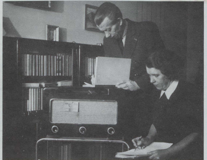
Radioescuchas en Praga, Checoslovaquia, copian mensajes de un programa de la RCI durante la Segunda Guerra Mundial.

Las transmisiones internacionales en onda corta no son la única vía en que los programas de RCI llegan a las audiencias de otros países; también se graban discos que se distribuyen a estaciones de radio de otros países. Los títulos de la colección de discos producidos por la División de Servicios Grabados y de Otros Programas de RCI incluyen programas hablados y música.