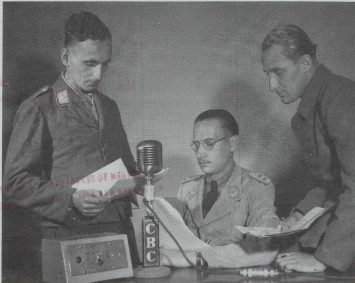
Las emisiones internacionales de RCI a la Europa Occidental permitieron a prisioneros de guerra alemanes transmitir mensajes familiares.

As It Happens , Sunday Morning y The House , destinados a los turistas y trabajadores canadienses que se encuentran en el extranjero.