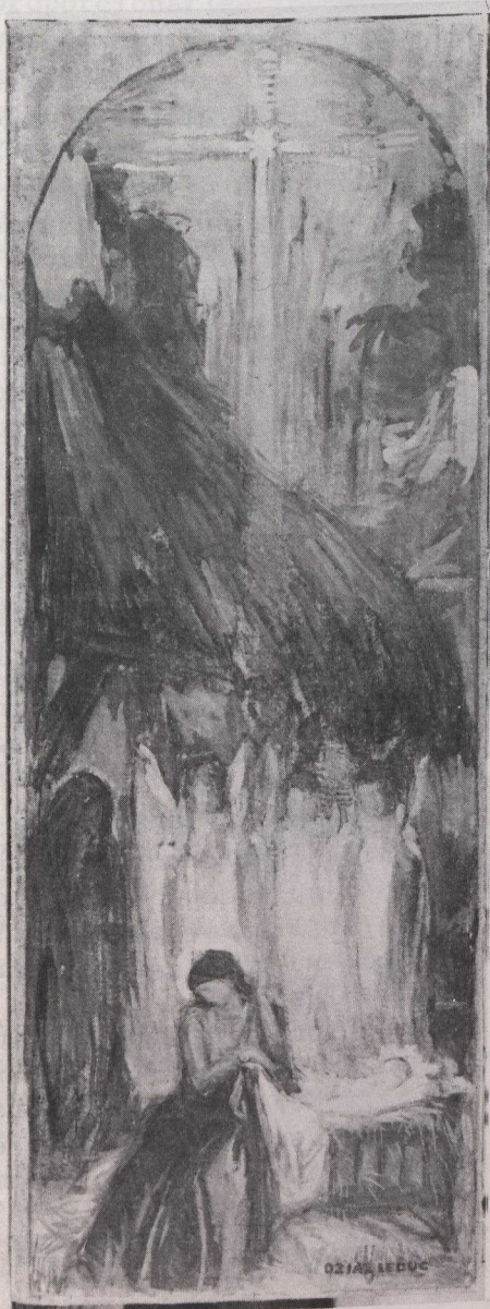
"Natividad", boceto de decoración para la Iglesia de San Rafael, Ile Bizard (1922)

Del 28 de marzo al 28 de abril se celebrará en el Centro de Cultura Canadiense de París la exposición de obras religiosas simbolistas del pintor autodidacta de Quebec Ozias Leduc (1864-1955) cuyas obras fueron expuestas recientemente en la Galería Nacional de Ottawa. Del 1 al 30 de junio se expon-