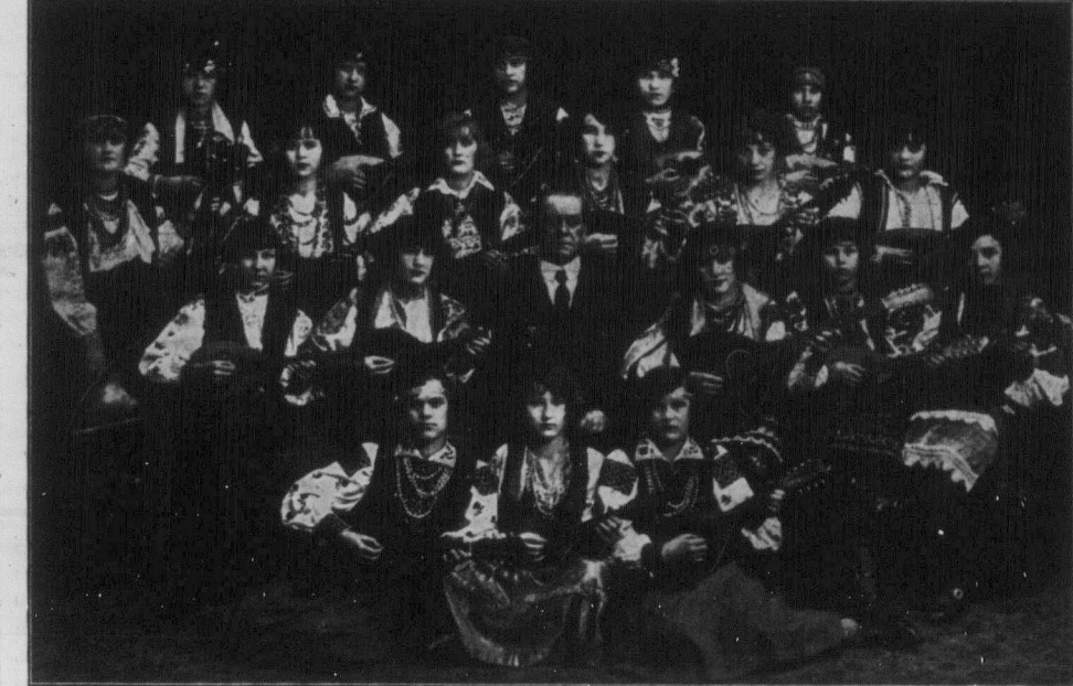
Перша група мандолінової оркестри при Укр. Роб. Домі в Вінніпегу виїждить дня 24. липня з концертами до слідуючих місцевостей: Форт Френсес, Вест Форт Вільям, Форт Вільям і Порт Артур. Перший концерт дасть в Форт Френсес в п'ятницю, 24. липня в Town Hall. В суботу прибуде до Форт Вільям і дасть кілька концертів в цих трох місцевостях. Повертаючись назад дасть ще один концерт в Форт Френсес. Українські робітники й робітничі вище згаданих місцевостей повинні не оминати цієї рідкої нагоди почути гарні українські народні пісні у виконанні вінніпегської української мандолінової оркестри. Слідить за оголошеннями на місця.