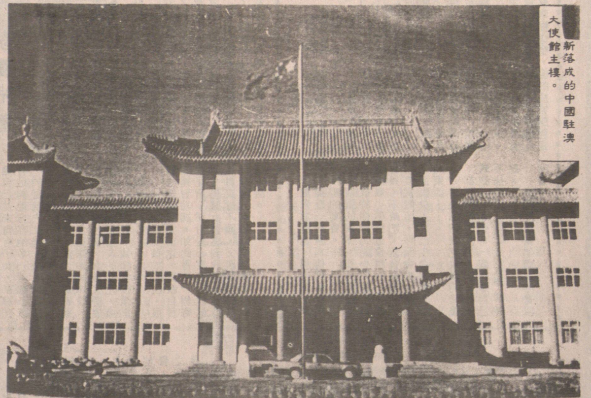
新落成的中國駐澳大使館主樓。