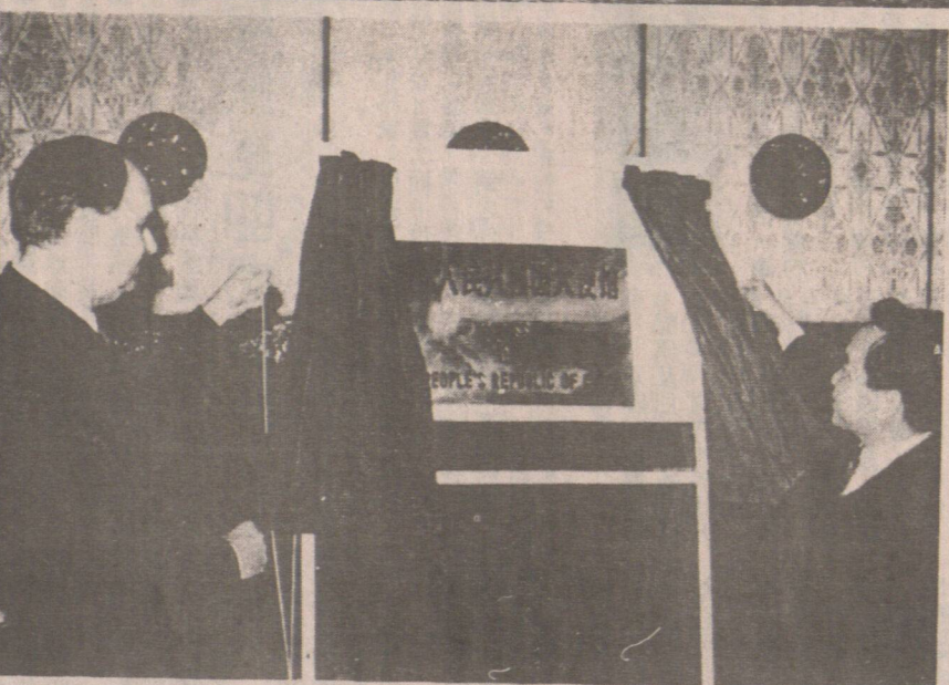
外貿部長達菲為新使館落成揭幕。

中國駐澳大利亞大使館新館舍最近落成。新使館於一九八八年十二月動工興建，其建築面積為七千一百三十一平方米，再配以中國庭院建築和園林綠化，共佔地二萬一千三百四十平方米。新使館的建成是中澳兩國人民和技術人員共同努力的結果。這座位於堪培拉風景秀麗的格利芬湖畔，具有傳統中國建築藝術風格的建築物，也為澳大利亞首都增添了一景。