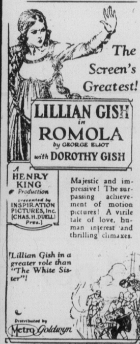
Lillian Gish in a greater role than "The White Sister"

Lilla Lee tient le rôle féminin dans cette superbe vue Paramount. Les fables d'Esopes, une comédie et les nouvelles hebdomadaires du Keith complètent cet excellent programme.